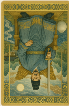
소드 왕 (역)