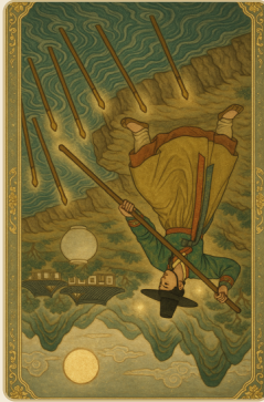
완드 7 (역)